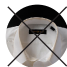
襟が黄ばんでいる