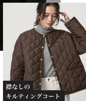
襟なしの キルティングコート