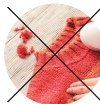
毛玉がついた ニット