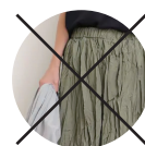
シワシワのスカート